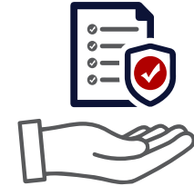
COPERTURA ASSICURATIVA COMPLETA RCA, Kasko, furto e incendio