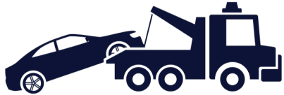
ASSISTENZA STRADALE H24 con traino vettura