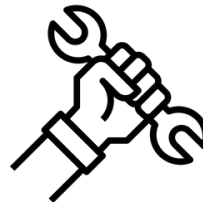
AUTORIZZAZIONE ALLA RIPARAZIONE Se convenzionato