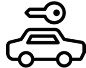
PROGRAMMA NOLEGGIO BREVE E LUNGO TERMINE*

*Le modalità di attivazione del programma possono subire variazioni nel tempo